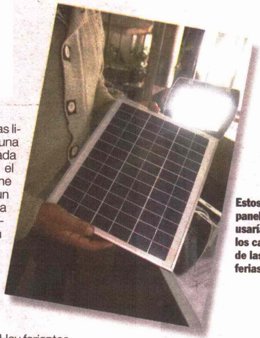
Estos paneles se usarían en los carros de las ferias.

El ejecutivo dice que implementar un carro es muy simple. "Lo único que necesitamos saber es la cantidad de equipos eléctricos que tiene en su ca-