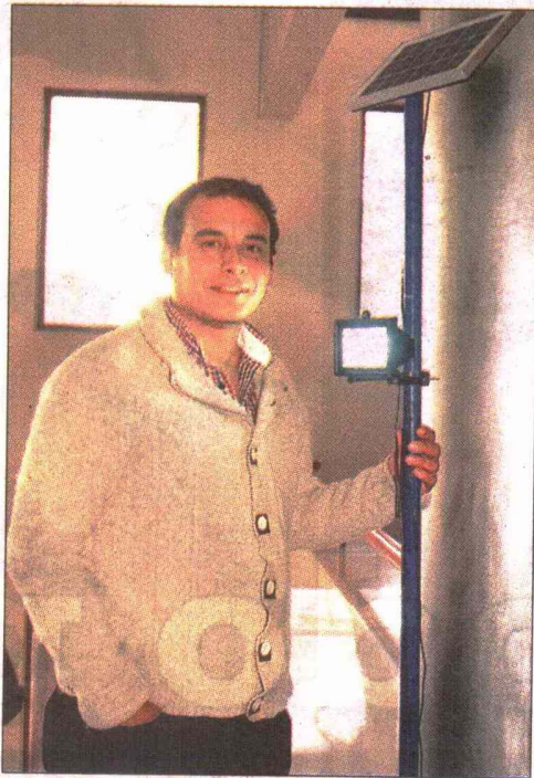
"La energía solar tiene grandes ventajas", comenta Basic.